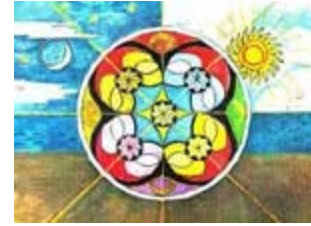
Mandala jungiană, reprezentare grafică a centrului. Click pe imagine pentru o versiune mărită.

În practicile yoga mandala poate fi un suport pentru meditație sau o imagine care trebuie internalizată prin absorbție mentală. Această imagine organizează energiile și forțele interioare ale adeptului și le pune în relație cu eul său.