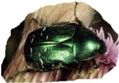
Cetonia aurata sau cărăbușul de aur.

Ideea este, deci, de coincidență: în acest caz, între cărăbușul visat de pacientă și apariția lui în realitate, în cabinetul de psihoterapie.