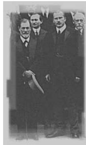
Freud (primul din stînga) și Jung (centru) la un congres de psihanaliză

Controversele au fost incitate și parțial compensate de înțelegerea pe care Jung a găsit-o la Theodore Flournoy (foarte influențat de pragmatismul lui James) și de deschiderea intelectuală pe care a crezut că o găsește la Creuzer, lecturînd "Simbolismul și mitologia popoarelor" (1909-1910). Sub influența acestor noi maestri, el va scrie din 1912 Metamorfozele și simbolurile libidoului .