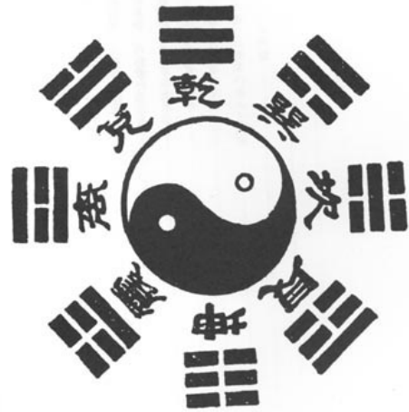
I Ching - cele opt trigrame (pa-kua).

În introducerea la versiunea engleză a I Ching , Jung recunoaște că a practicat oracolul cu treizeci de ani înaintea întâlnirii cu Richard Wilhelm, poate cel mai important traducător al Cărții într-o limbă occidentală. Jung se folosea de carte, susține el, pentru explorarea inconștientului . Ulterior, discipolii săi vor utiliza pe larg oracolul în psihoterapie. Ca să dau numai un exemplu: când un pacient a consultat cartea cu privire la intenția sa de a avea o legătură cu o femeie față de care nutrea sentimente ambivalente, oracolul a răspuns cu hexagrama nr. 44 - A veni la întâlnire - care spune textual: Nu trebuie să te căsătorești cu o asemenea fată . Ceea ce frapează este evident faptul că oracolul a răspuns cu o hexagramă care surprindea situația actuală a pacientului.